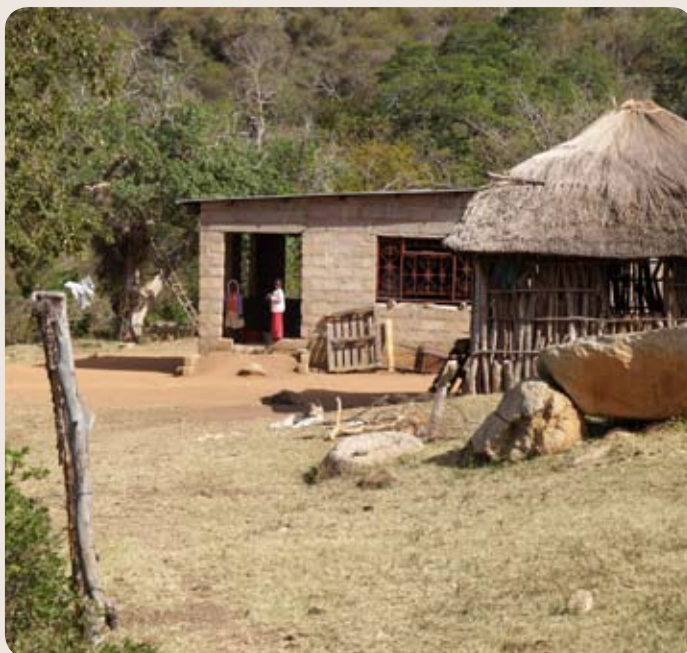
Zum Bild: Der Großteil der Bevölkerung lebt in ländlichen Gebieten.

Quellen: www.welt-in-zahlen.de, UNDR, Fischer Weltalmanach