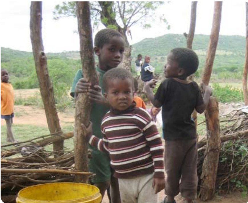
Zum Bild: Waisenkinder müssen häufig von älteren Verwandten oder von der Dorfgemeinschaft aufgezogen werden.

eine weitere Einnahmequelle, spielt aber, seit die Eisenerzvorkommen zur Neige gingen, keine große Rolle mehr. Swasiland hat keine eigene Küste und ist daher im Handel beschränkt.