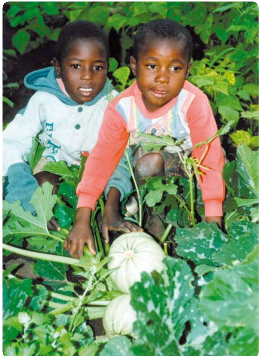
Zum Bild: Etwa 80 Prozent der Bevölkerung leben von der Landwirtschaft.

Die wichtigste Erwerbsquelle der Menschen ist die selbstversorgende Landwirtschaft, von der schätzungsweise 80 Prozent der Bevölkerung leben. Die bedeutsamsten landwirtschaftlichen Produkte sind Zuckerrohr, Holz zur Papierherstellung, Baumwolle, Mais, Tabak, Reis, Zitrusfrüchte, Hirse und Erdnüsse. In weiten Teilen Swasilands ist der Boden jedoch durch die übermäßige Nutzung als Weideland ausgelaugt. Der Bergbau war bis in die siebziger Jahre