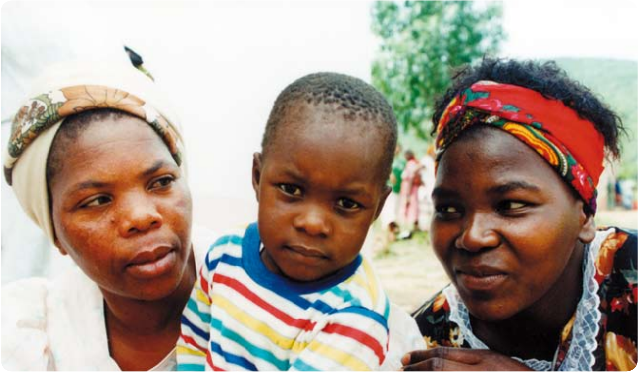
Zum Bild: Nächstenliebe und Nachbarschaftshilfe werden in Swasiland groß geschrieben. Die Menschen kämpfen täglich gegen die Armut.